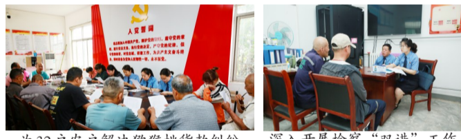
为32户农户解决猕猴桃货款纠纷

用力拓宽检察诉源治理“新渠道”。常态化推进检察“双进”工作，在群众信访、司法救助、检察听证等工作中坚持重心下移、关口前移。通过打造“终端+平台”模式，在全区5个镇办“检察之窗”配套移动检务终端，开发可视化信访会见系统，实现群众诉求即时反映、就近反映，实现诉求一键式通达。