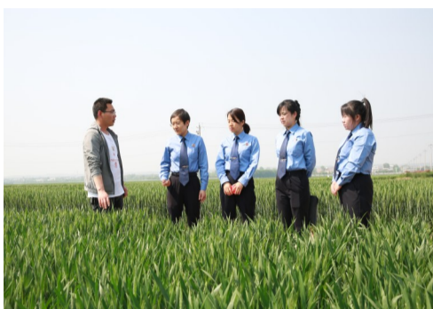
“检察蓝”守护农业知识产权

指引，做到一切工作“从政治上出发”，完善落实“第一议题”制度，推动理论学习制度化。党组理论中心组“先行学”，各支部、党小组、党员“层层学”，在深学细悟中举旗定向、维护稳定、促进发展、保障善治，厚植坚定拥护“两个确立”、坚决做到“两个维护”的政治底色。