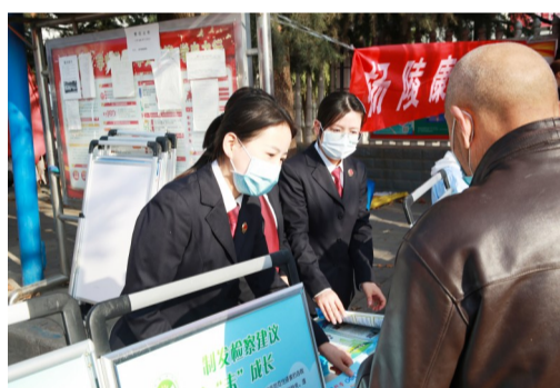
开展平安建设普法宣传

近年来，杨陵区检察院始终坚持紧盯服务“国之大者”“省之要事”“区之要情”，以服务保障现代农业为重点，自觉地把检察工作融入杨陵发展大局之中思考、谋划、部署。全力以赴助力“三个年”活