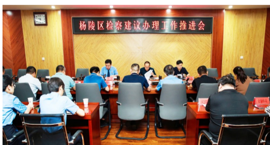
杨陵区检察建议办理工作推进会召开

推动类案治理。在生态环境保护、食品药品安全、侵犯个人信息等方面，发现公益诉讼线索138件，立案126件，发出公益诉讼诉前检察建议112件，诉前整改率100%。同时充分借助“外脑”，以“检察官+专家”的办案模式，在疑难、复杂等专业性领域获取专业支持。大力推进“益心为公”检察云平台建设发展，广泛动员注册志愿者21人，拓宽案件线索发现渠道。