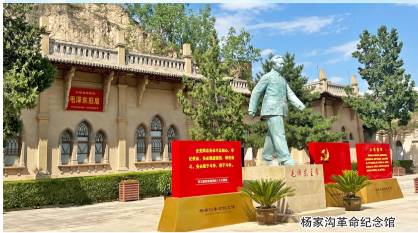
杨家沟革命纪念馆