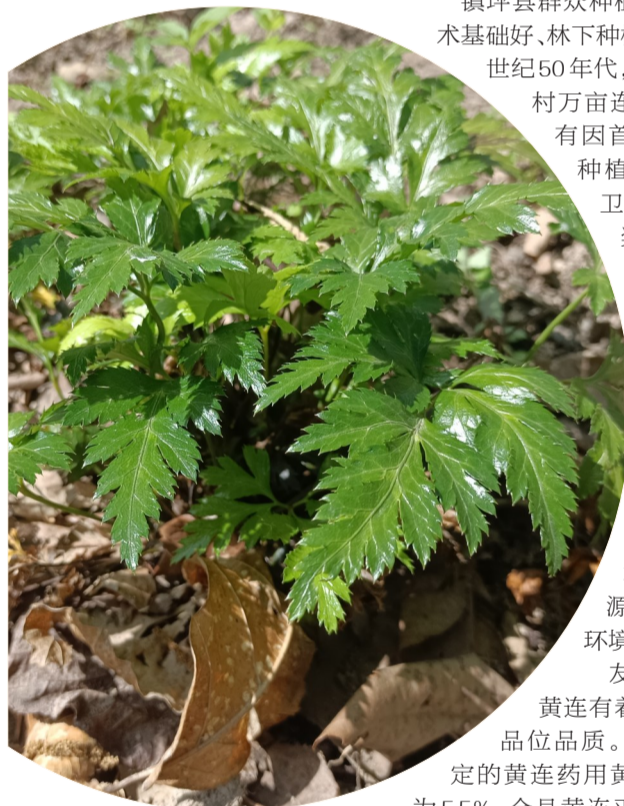
友谊村万亩黄连林下经济基地的黄连长势旺盛。