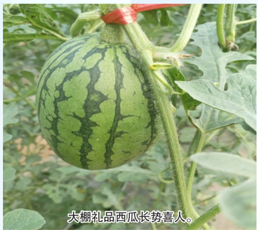
大棚礼品西瓜长势喜人。