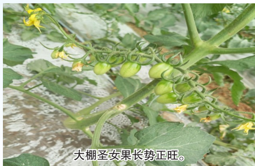
大棚圣女果长势正旺。