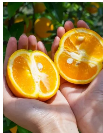
(本版稿件综合人民网、新华网、《四川农村日报》)