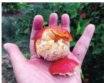
红韵香柑轻松易剥。

3月8日,在四川省内江市农村工作会参观现场,东兴区田家镇火花村特意展示了一款奇特的柑橘。只见其颜色貌似塔罗科血橙,是紫红色,形状又像宽皮类柑橘,并具有宽皮类柑橘易剥的特点,剥开果皮竟能闻到一股花椒的香味,果肉甜度好且微带果酸。