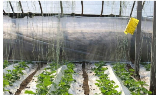
大棚前脸安装挡湿膜保温又降湿。

应对措施: 做好额外的保温措施。一是前脸内侧悬挂一层薄膜,一般来说可晚上挂白天收起,避免影响光照强度。二是外侧保温被内额外覆盖一层无纺布或旧保温被等。同样外侧地面上也可适当进行覆盖,起到加固、防渗水和保温的作用。三是在蔬菜未吊起前,也可设置东西向的小拱并覆膜。此外,若是种植喜高温蔬菜,也可设置“棚中棚”,保温效果更好。