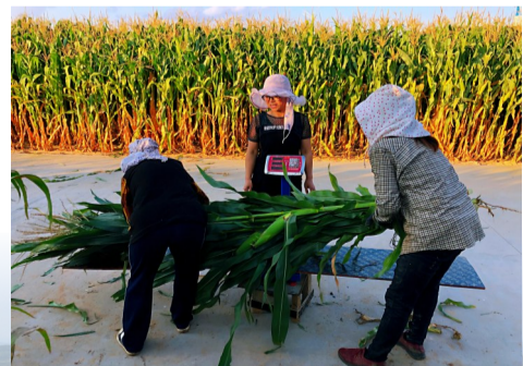
村民采收青贮玉米

生态产业化、产业生态化。“十四五”时期,榆阳区将用智能化、产业化的思维和循环经济发展理念,多措并举激励草产业“生态+生产”协同发展,与乡村振兴深度融合,全力将榆阳打造为集种草、加工、销售为一体的长城沿线风沙区饲草集散中心,陕北地区草业知名品牌示范区,陕西省草业科技示范区、优质饲草和绿色畜产品供应区和新时代“中国草业明珠”。