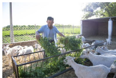
山地种草,羊子进羊舍,“坐享”好饲草

北部草滩区发展高产优质饲草,东南部山区怎么办?山区的小型养殖场怎么破解饲草难题?为此,榆阳区进行了积极探索。