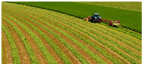
位于岔河则乡白河庙村近3000亩苜蓿基地正在进行第三茬刈割

确定为农业优势主导产业之一,4年安排资金8000万元,推进饲草产业发展,通过连续几年全方位配套扶持,涌现出