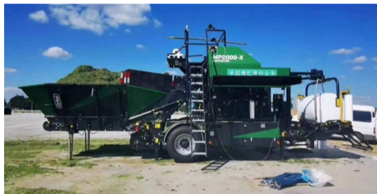
青贮玉米收获、粉碎