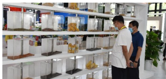
参会者参观杨凌“种子墙”。

记者了解到,去年,杨凌种业创新实现了近年来最好水平,陕西省通过国审的7个小麦品种有6个出自杨凌,43个玉米新品种通过省级以上审定,两家种业企业入围全国油菜十强企业。